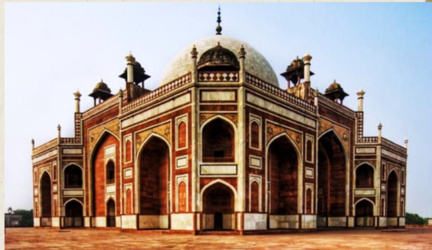
Мавзолей султана Насір ад-діна Хумаюна

У ісламських країнах є чимало мавзолеїв, шанованих населенням, вони представляють релігійну і архітектурну цінність.